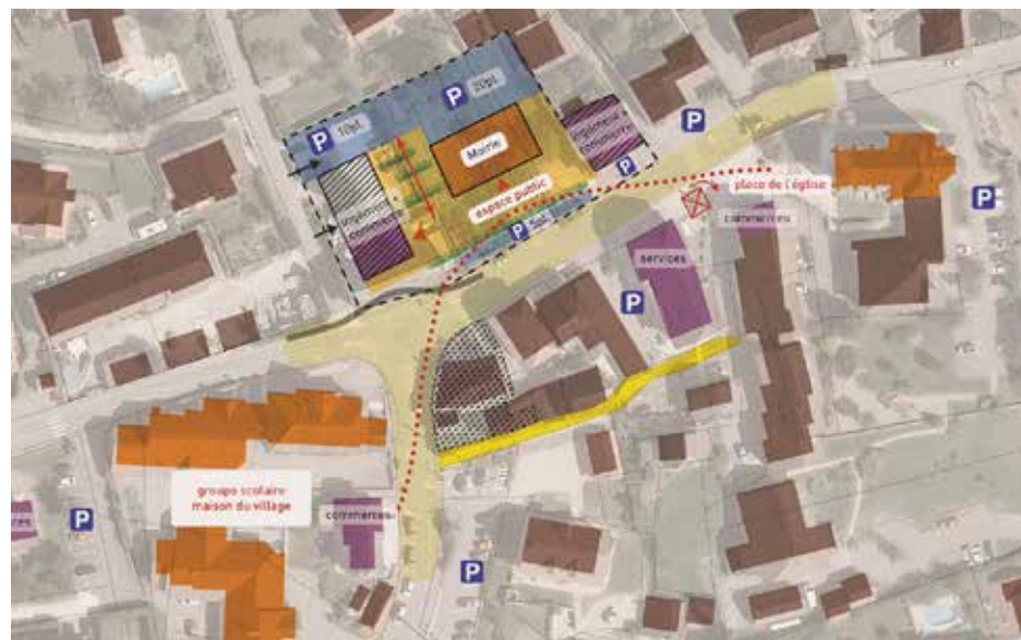
Hypothèse de restructuration du coeur de village